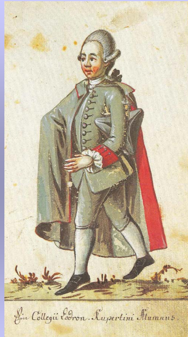
Ende 18. Jahrhundert