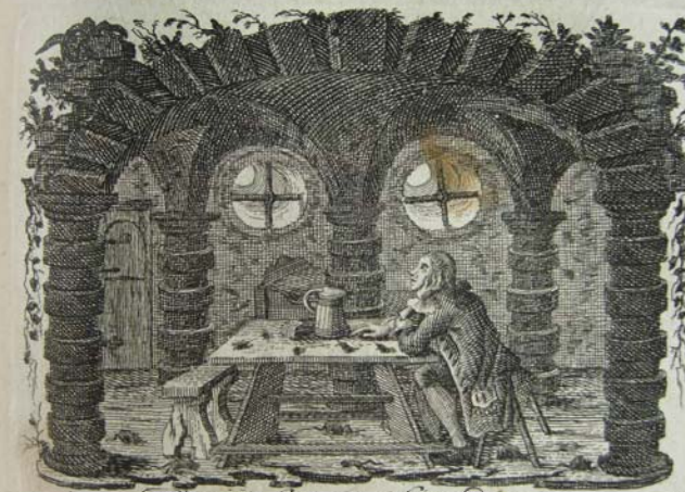
Der im Carcer Sizente.