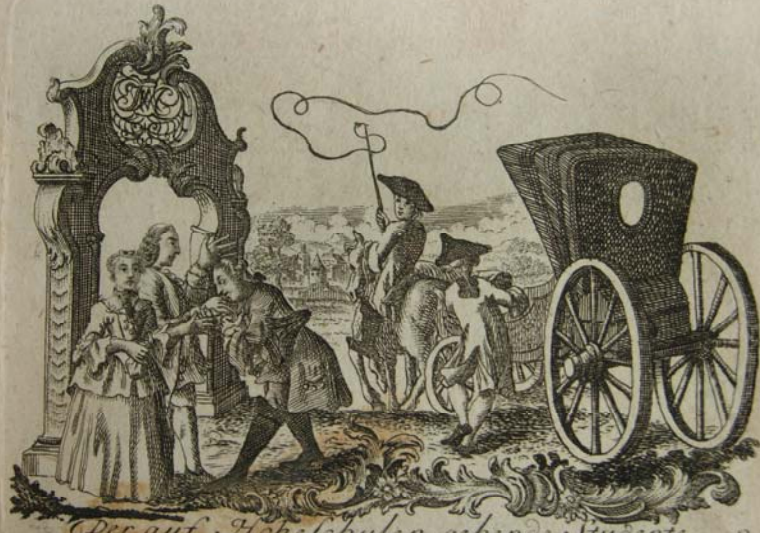
Der auf Hochschulen gehende Studente.