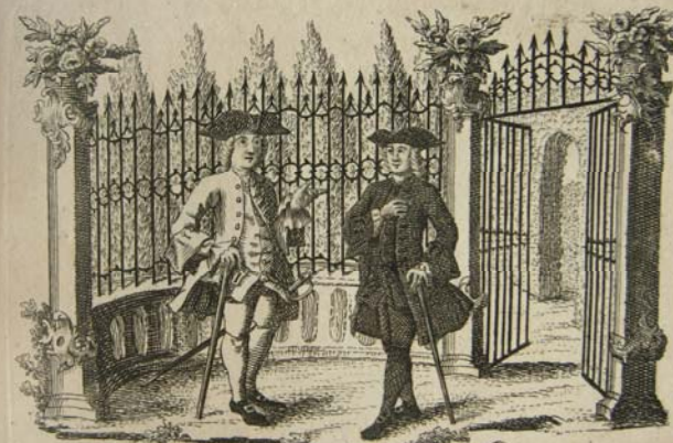
Der Candidatus Theologiae und Juris.